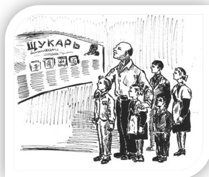
Рисунки Андрея Костяева Иллюстрации в журнале «Первые шаги». (июнь 1961 г.)

Главный редактор: Василенко И.Л., директор школы Выпускающий редактор: Маракулина Т.В., руководитель музея Компьютерная верстка: Ярославцев В.Л., учитель информатики