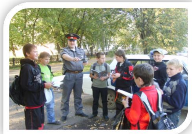
Практическое занятие юных инспекторов дорожного движения с сотрудниками ГИБДД