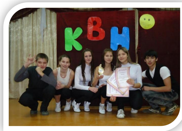
Команда КВН 9-а класса